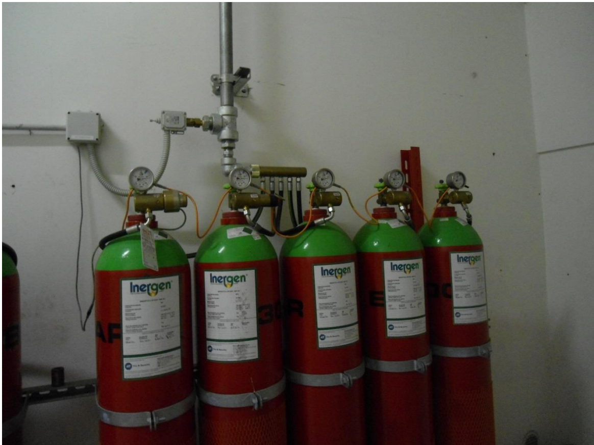
Gruppo comparto 4