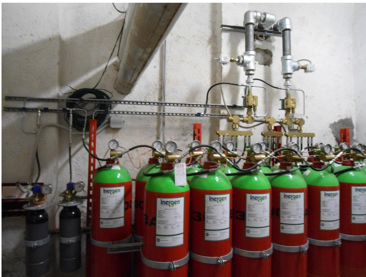
Gruppo comparto 1-2-5-6-8