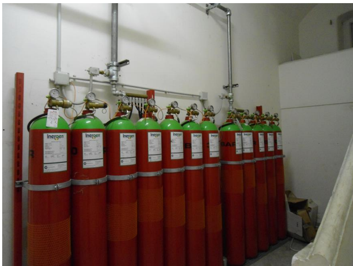
Gruppo comparto 3-4