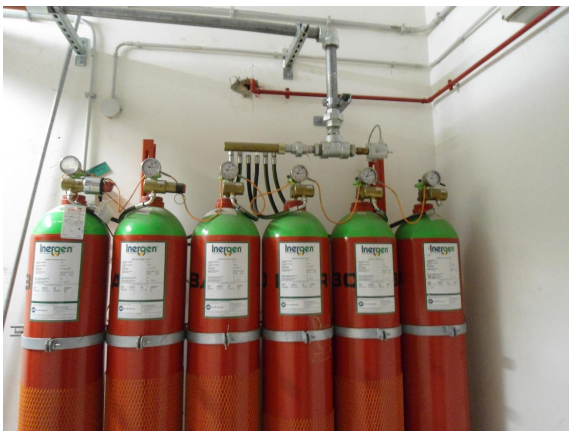
Gruppo comparto 7