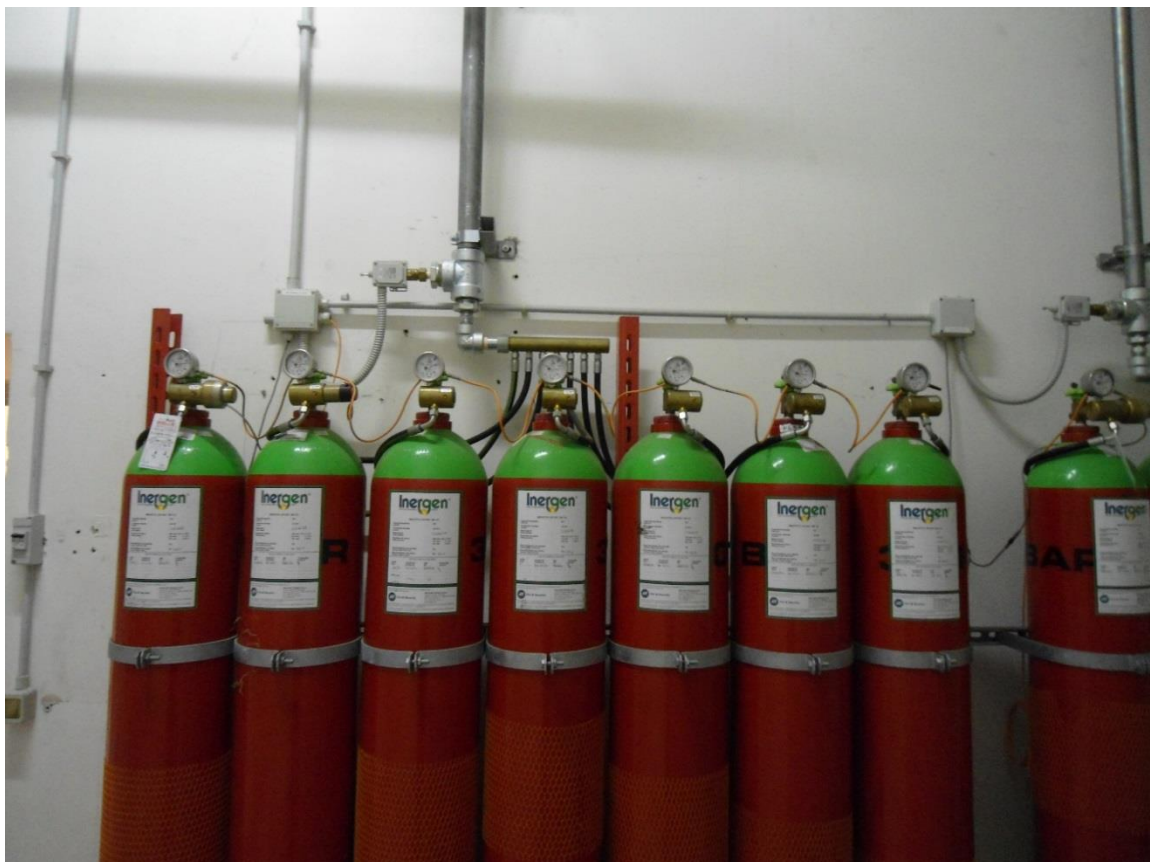
Gruppo comparto 3