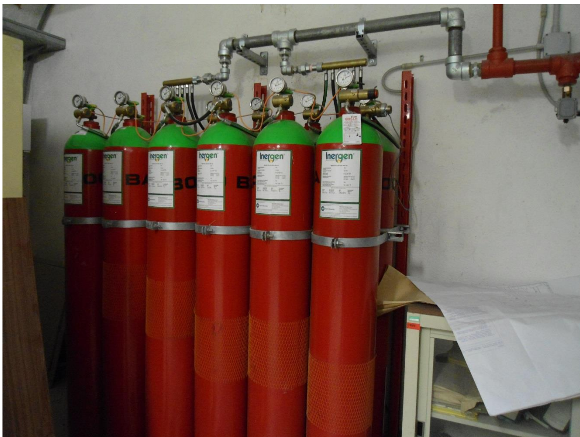
Gruppo comparto 12